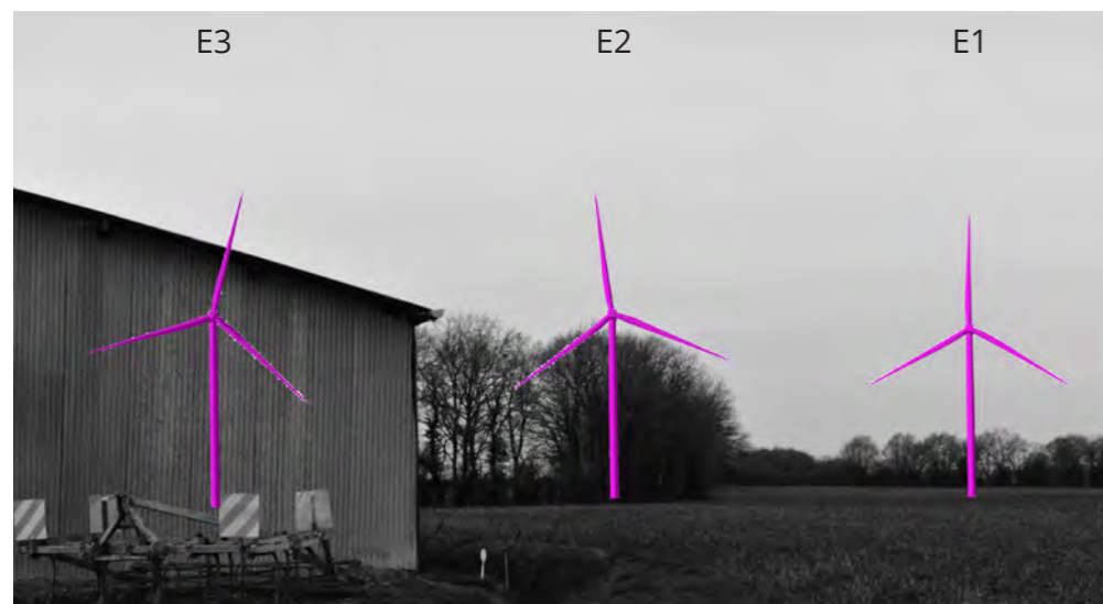
Etat projeté avec esquisse